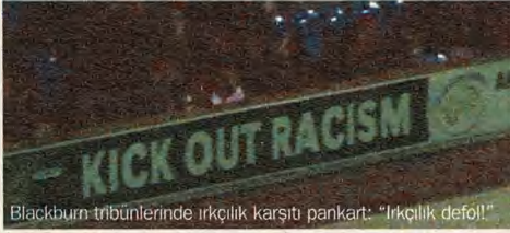
Blackburn tribünlerinde ırkçılık karşıtı pankart: "İrkçilik defol!"

Ankaralıyım. Gençlerbirlikliyim. Epeydir Hollanda'da yaşıyorum. Haliyle, tribüne devam edemiyorum. Fakat bu sezon taraftarlık hayatımın en mutlu sezonu: Tam üç yurtdışı deplasmanında tribündeydim. Bir beraberlik, iki galibiyet! UEFA Kupa Finali'nin oynanacağı 19 Mayıs'a dek üç deplasmana daha gitmeyi umut ediyorum. Ne de olsa final maçı tarafsız sahada, iki takım için de deplasman sayılmaz. Üç deplasman daha! Neden olmasın? Şimdi yolun tam ortasındayken bundan önceki deplasmanları yazmalı. Ama ewela, Ankara haricinde ikâmet edip taraftar olmak ne demek, onunla başlayayım.