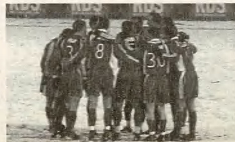
Her maçtan insanın aklında silinmeyen görüntüler kalır. Parma maçından yadigar kalan, başlama vuruşundan evvel bizimkilerin karlarla kaplı sahadada birbirlerine sarılarak oluşturdukları çember.