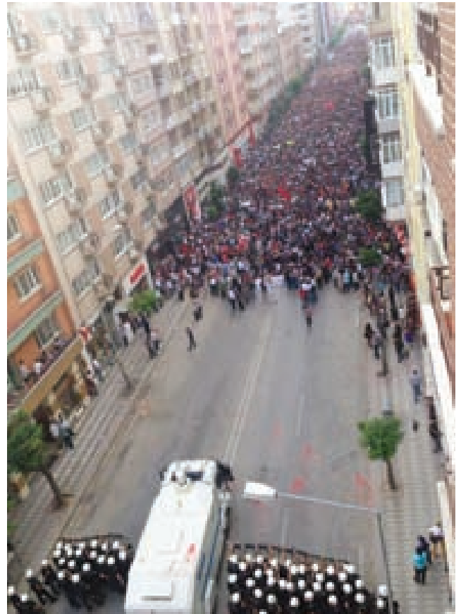
Eskişehir direnişin önemli merkezlerinden biriydi